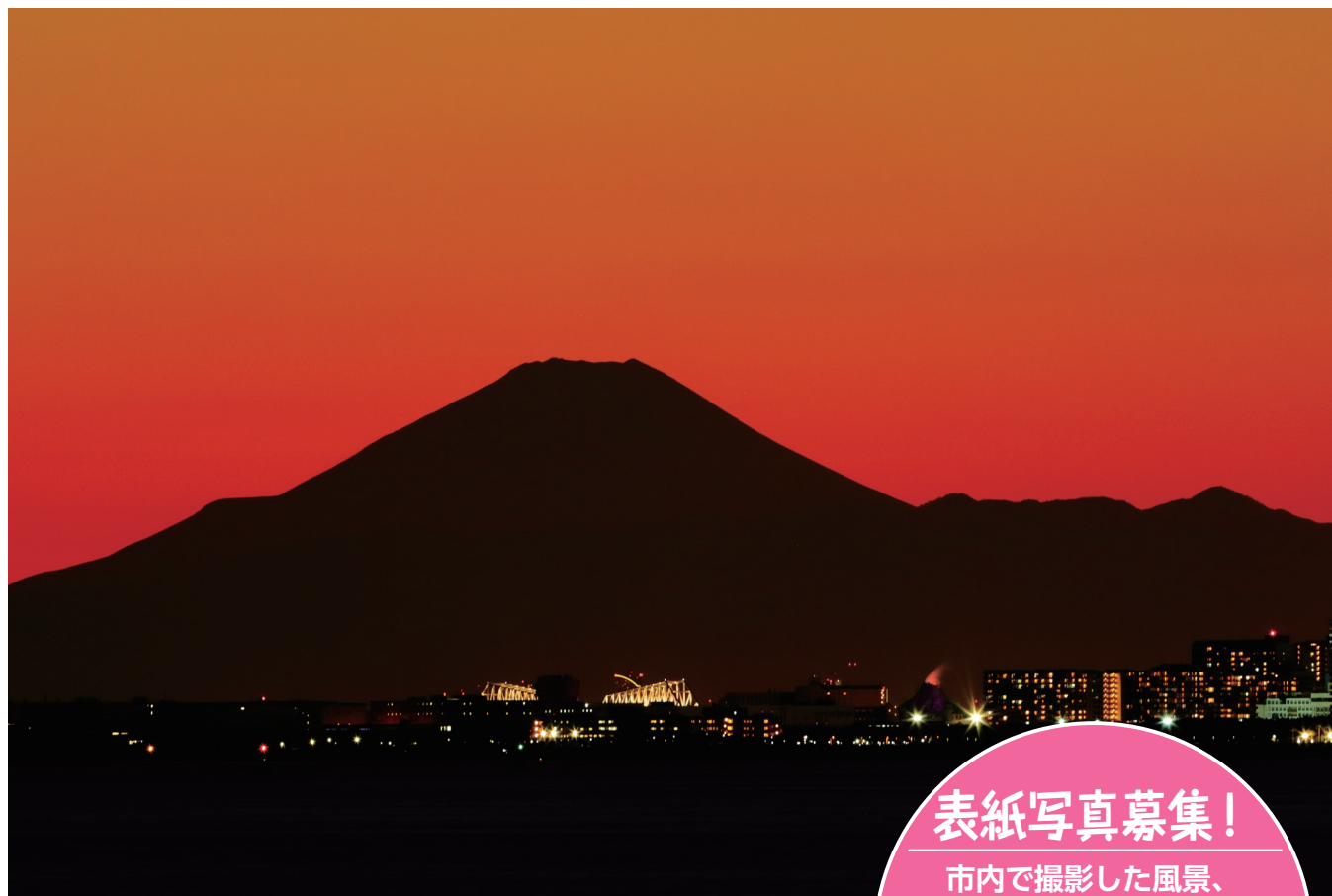
シルエット

コメント：条件が良いと見事に染まります。市内からは、こんな風に富士山と東京ゲートブリッジと東京ディズニーリゾートも一緒に収めることが出来ます。