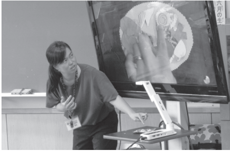
図工の授業。教員が作品例を大きく明示することで、子供たちは学習の進め方を理解することができる。