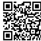
【QRコード】花の実園のホームページへ

申請内容の審査、評価の結果、「社会福祉法人 習愛会」については、「花の実園」が実施する障害福祉サービスの安定的な継続、利用者に対する十分な配慮、サービスの向上を目指す積極的な提案があったことや、管理運営を適正に行う財政的、人的能力を十分に有していることなどを総合的に勘案し、指定管理者の候補者としたものです。なお、指定の期間は、令和3年4月1日から5年間とします。