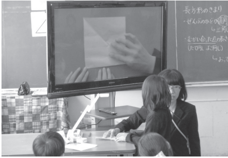
算数の授業。説明の際に装置を用いることで、子供たちは自分の考えを分かりやすく伝えることができる。