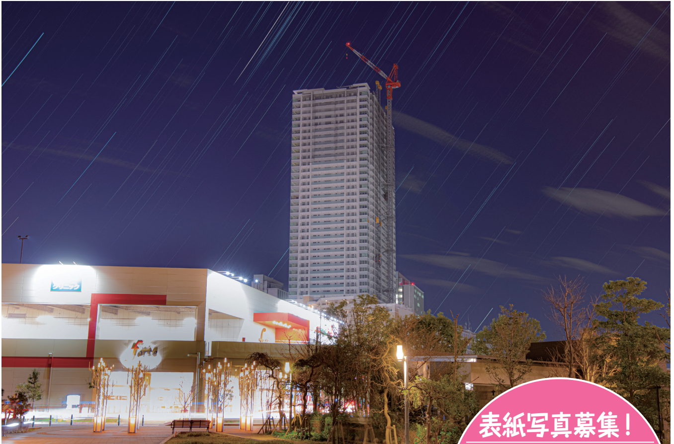
New Symbol(津田沼の夜空に建つ) 撮影者:鈴木 俊成 様 コメント:県内の建築物で有数の高さを誇るタワーマンションを、星の日周運動と共に撮影しました。 習志野の今後の発展に相応しい新しいシンボルが完成したことを嬉しく思います。

令和2年(2020年)2月1日発行 発行 習志野市議会 編集 議会報編集委員会 住所 〒275-8601 習志野市鷺沼2丁目1番1号 電話 047(453)9232 FAX 047(453)7767 メール gikai-2@city.narashino.lg.jp