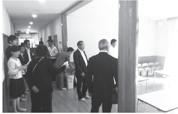
私立こども園を視察（ブレーメン実花こども園）