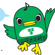
習志野市ご当地キャラクター ナラシド