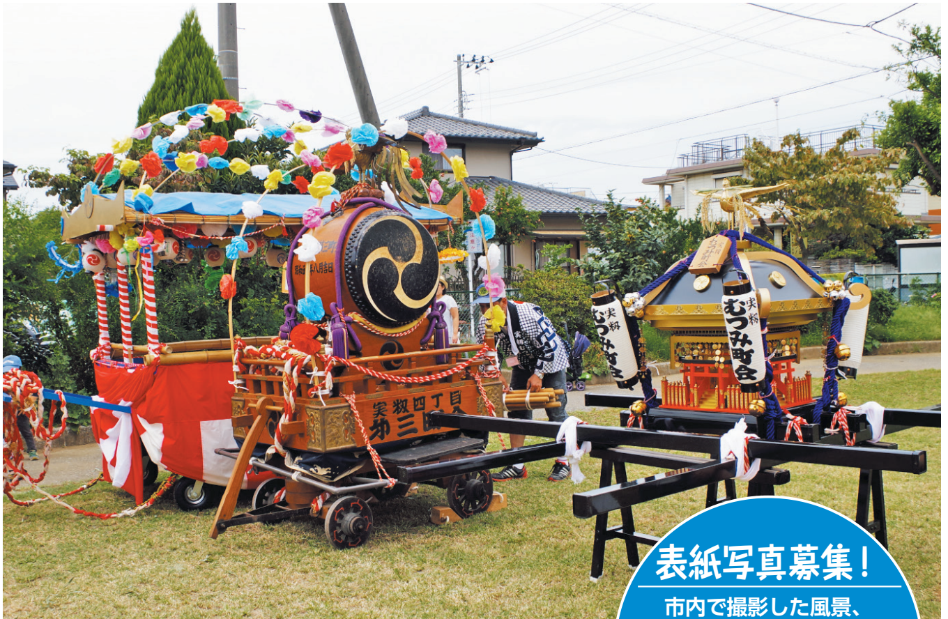
担ぎ手を待つ御輿(実碓むつみ町会お祭り・こども祭り、実碓2号公園)