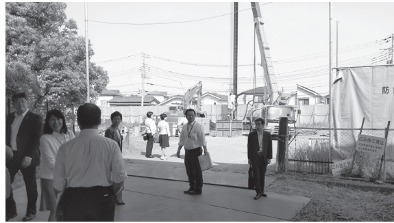
作業中の現場を視察