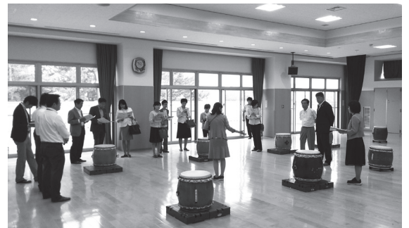
園長による説明。遊戯室には、この日保育で使用する和太鼓が置かれていた（袖ヶ浦こども園）

本市議会では、議長の発案により平成29年度から、市議会議員が市の業務並びに制度に関する知識を培い、議員活動に資することを目的とした勉強会「専門業務説明会」を開催しています。 平成30年5月16日に開催した、第3回専門業務説明会では、市内にあるこども園及び保育所等を視察しましたので、その概要をお知らせします。 今回は、本市の小学校就学