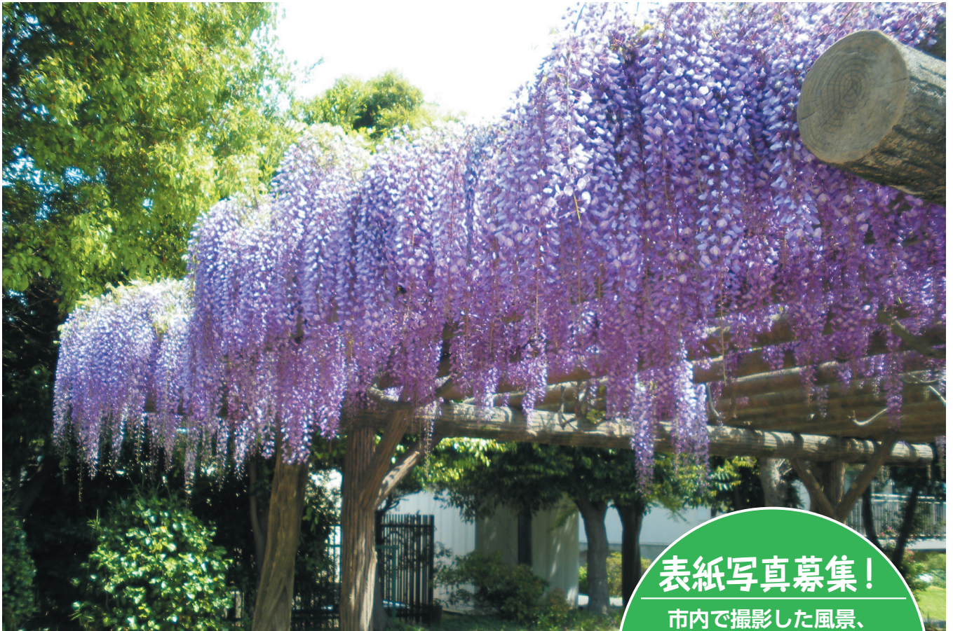
くじら公園(香澄2号児童公園)にて