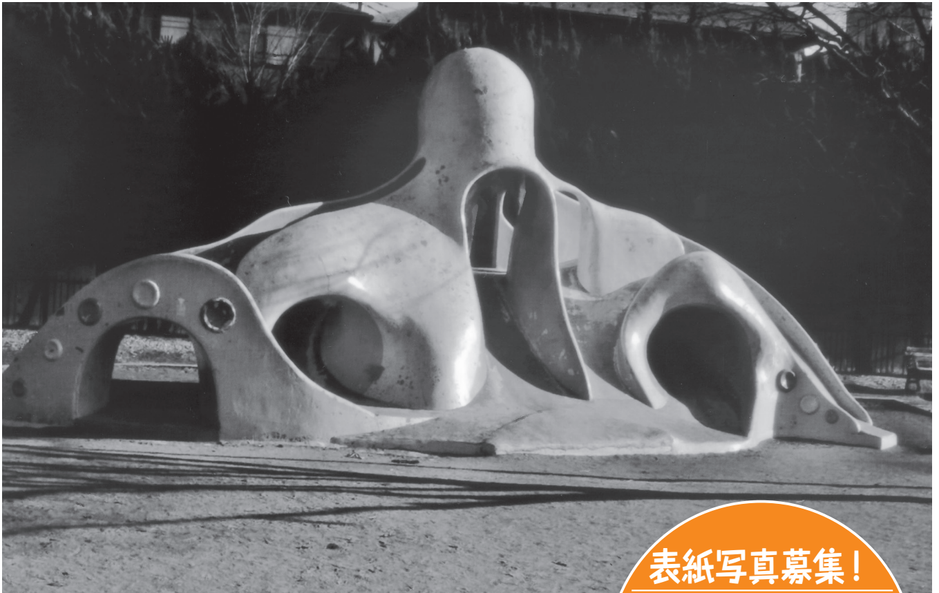
朝日に照らされるタコのオブジェ

コメント：中央公園（本大久保3丁目）のシンボリック的存在である、レトロを感じさせる「タコのオブジェ（すべり台）」です。全国的にこのような遊具が年々減っていますので、これからも残ってほしいと願い、撮影しました。