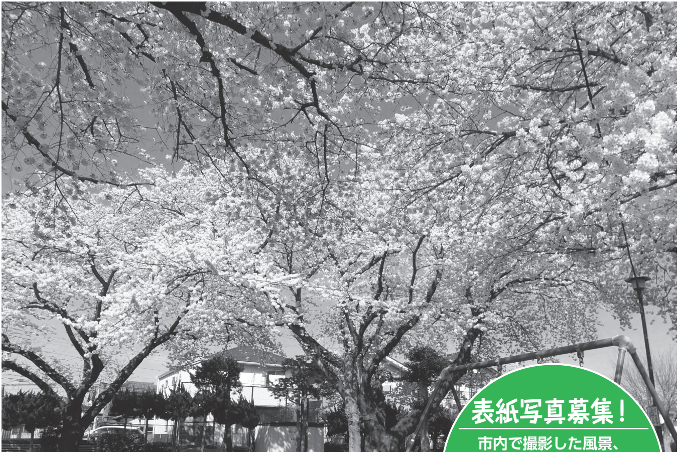
習志野市名木百選の桜(新栄1丁目)

コメント:バス通りに隣接している公園にこの大きな桜の名木があります。この時には人がいませんが、お祭りの時には櫓を囲んでカラオケ大会が行われ、それはそれは賑やかです。