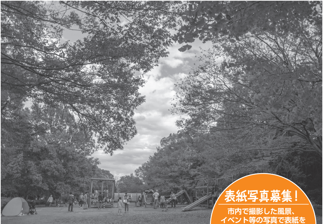
香澄公園の秋