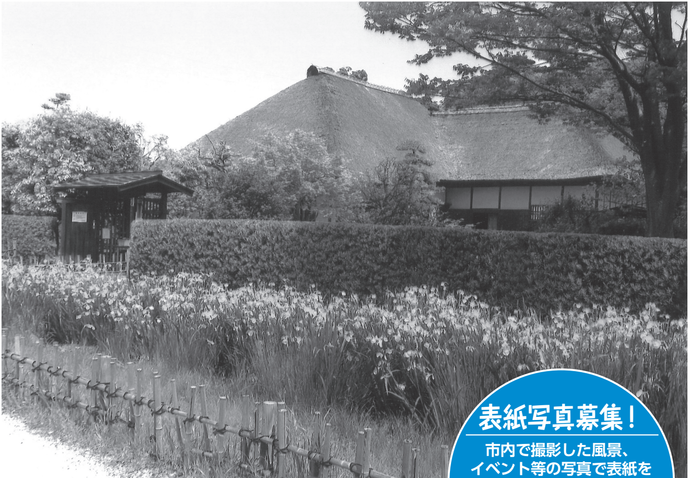
初夏の「旧鴉田家住宅」コメント：東日本大震災による被災から5年の歳月をかけて修復され、2016年4月に再オープンした「旧鴉田家住宅」と、正面の黄菖蒲が見頃を迎えた風景は、風情があって初夏の美しい景色に感じました。

平成28年(2016年)8月1日発行 発行 習志野市議会 編集 議会報編集委員会 住所 〒275-8601 習志野市鷺沼1丁目1番1号 電話 047(453)9232 FAX 047(453)7767 メール gikai-2@city.narashino.lg.jp