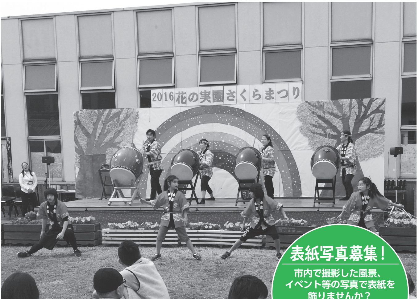
2016花の実園さくらまつり