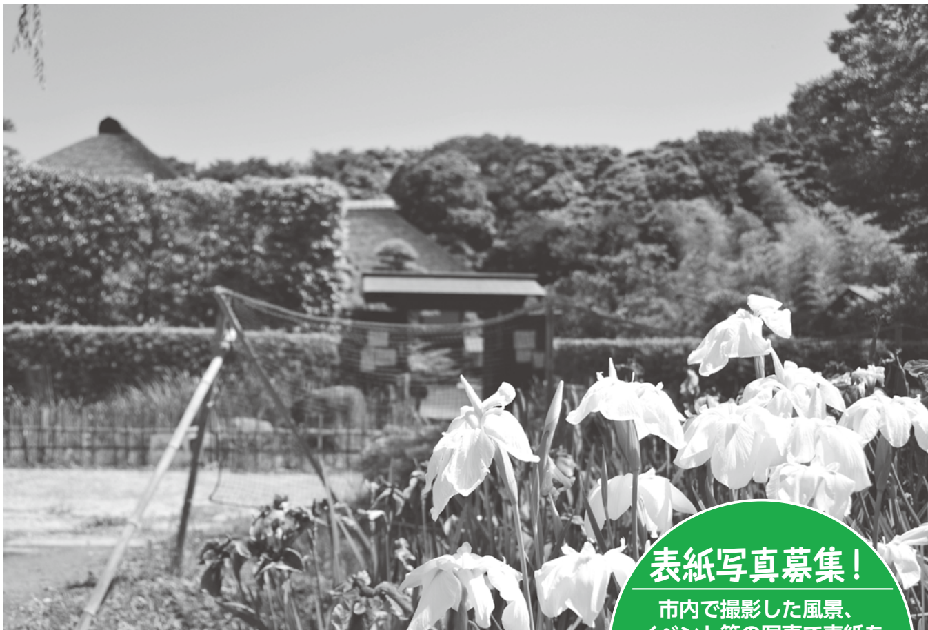
花菖蒲と旧鴉田家住宅(実籾本郷公園内)