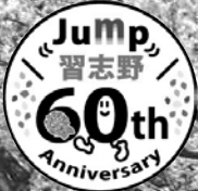
習志野市制施行60周年記念 ロゴマーク