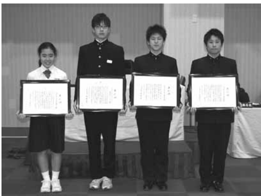
2月18日(火) 議場にて議長表彰を行いました。