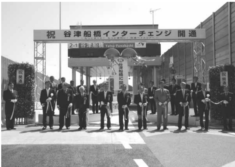
9月20日(金) 東関東自動車道 谷津船橋インターチェンジ開通 周辺道路の交通渋滞緩和や地域活性化などに期待