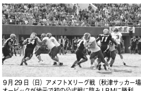
9月29日(日) アメフトXリーグ戦(秋津サッカー場) オービックが地元で初の公式戦に臨み1B.Mに勝利