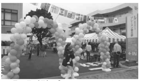
10月6日(日)プレーメンフェスタ(地域交流プラザ「プレーメン習志野」)

市民意識調査の結果から「スマイル」や「接遇地域ナンバーワン」として取り組まれないと評価する。人材育成・意