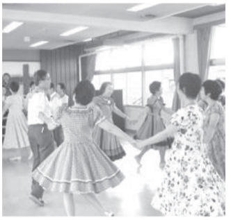
ダンスでいきいき楽しそう。ゆうゆう館文化祭にて(10月4日)

新たな「集中改革プラン」では事業の取捨選択を行うことだが、障害者、高齢者子育てに関する福祉も取捨選択の対象にするのか？ A 限られた財源のなかで、障