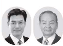
副議長 浅川 邦雄