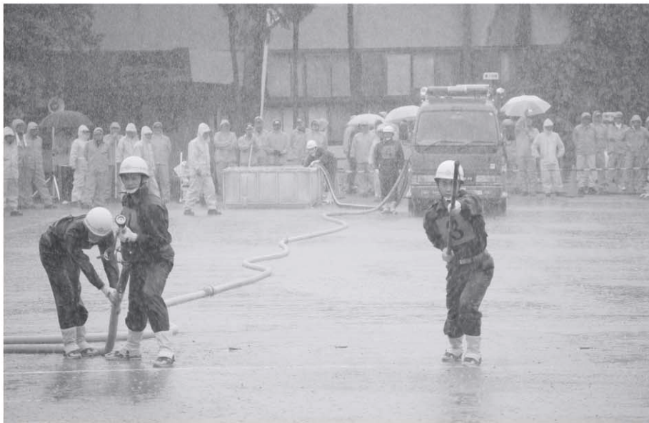
大雨の中、第42回消防団ポンプ操法大会が行われました。(6月21日)

平成21年(2009) 8月1日第143号 発行 習志野市議会 編集 議会報編集委員会 習志野市鷺沼1丁目1番1号 電話 047 (453) 9232 FAX 047 (453) 7767 http://www.city.narashino. chiba.jp/shigikai/