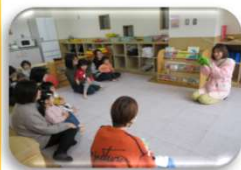
手袋シアター キャブツの中から

3月10日(火)にスペシャルわくわくタイムを行いました。 ご参加ありがとうございました☆