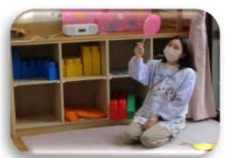
風船が色々なものに 変身するよ。ピンクの 風船は何になったかな？