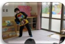
みんなで力を合わせて大きな にんじんが抜けました！