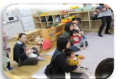
パネルシアター トンネルぐるぐる