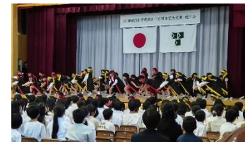
(津小150周年記念式典の様子)