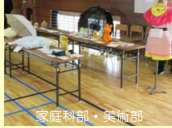
家庭科部・美術部