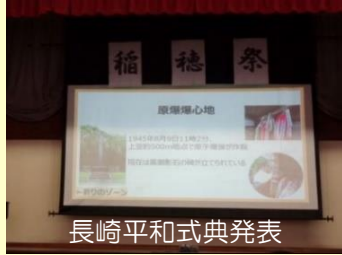
長崎平和式典発表