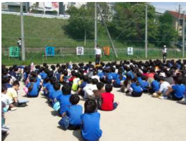
危機管理課の方のお話を聞いています。