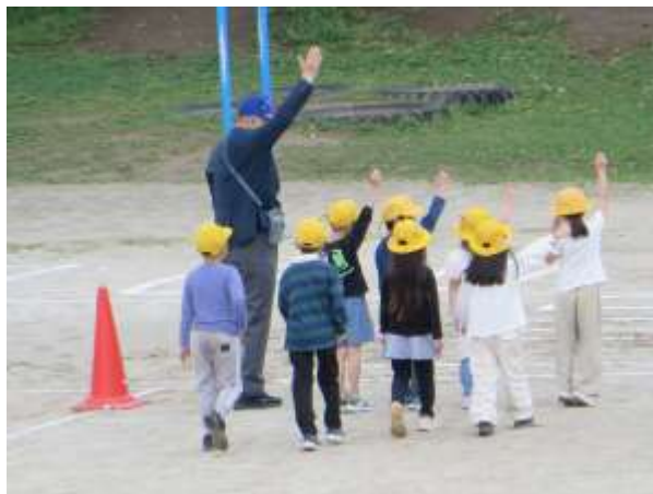
模擬道路で、左右を確認してから横断歩道を渡ります。