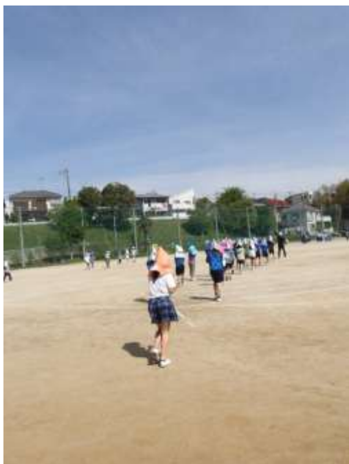
防災頭巾をかぶり、素早く避難しています。

4月22日(水)に、避難訓練を行いました。新しい教室からの避難経路を確認する目的です。災害はいつ起こるかわかりません。日常から、こうした訓練を真剣に行うことが、被害の拡大を防ぎ、大切な命を守るために最も大切となります。教職員の指導の下、子供達も真剣に取り組む様子が見られました。当日は、習志野市役所の危機管理課の方がお見えになり、訓練について御指導を頂きました。御家庭でも、非常時の備えや災害が起きた時の連絡方法など、日頃から確認しておくとういと思っています。ぜひ話し合ってみてください。