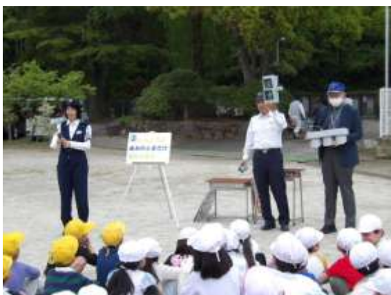
道路の渡り方について教えていただきました。