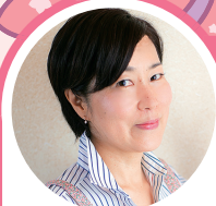
はやかわ先生からの 早川先生からの