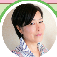
はやかわせんせい 早川先生からの