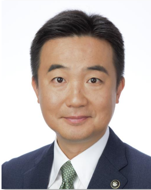
習志野市長 宮本 泰介