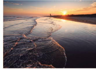
九十九里浜の夕焼け