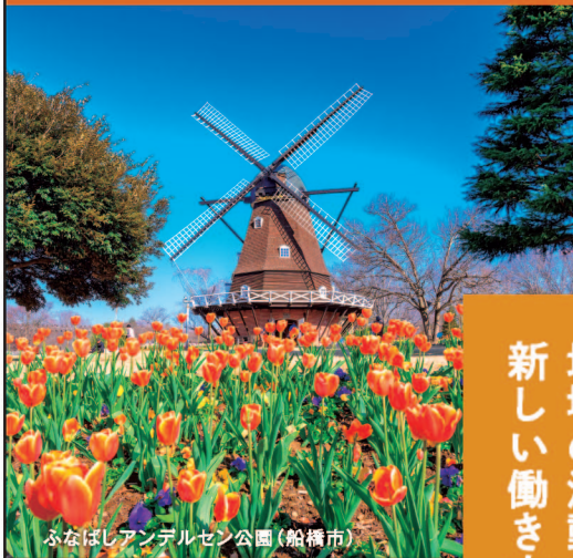
ふなばしアンデルセン公園(船橋市)