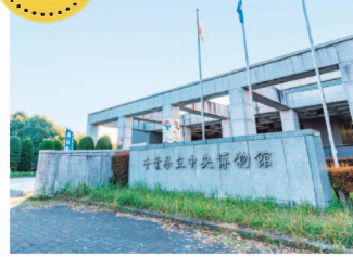
千葉県立中央博物館