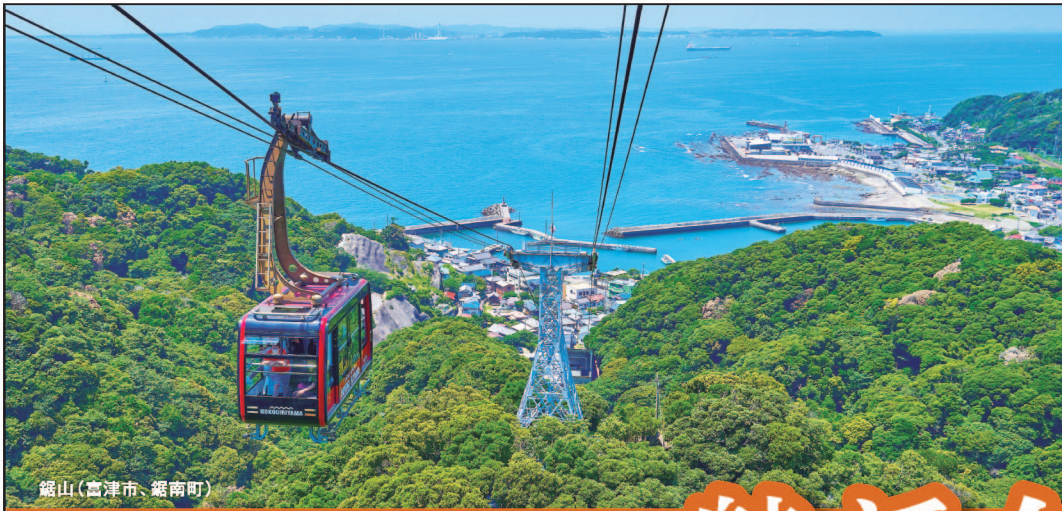
鋸山(富津市、鋸南町)