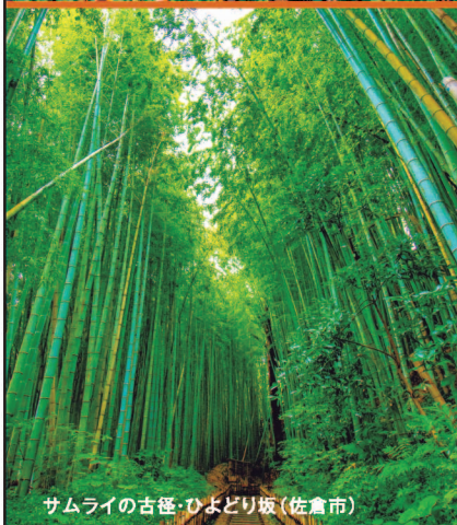
サムライの古笹・ひよどり坂(佐倉市)

年次有給休暇を取得して、家族と過ごしたり、地域の活動に参加したり、新しい働き方・休み方をはじめましょう。