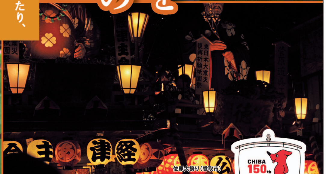
佐原大祭り(香取市)

厚生労働省 | 千葉労働局 | 労働基準監督署 ◎働き方・休み方改善ポータルサイト https://work-holiday.mhlw.go.jp/