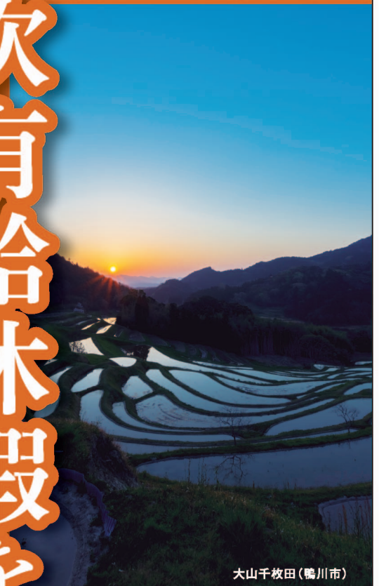
大山千枚田(鴨川市)