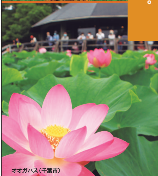
オオガハス(千葉市)