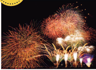
幕張ビーチ花火フェスタ