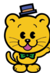
千葉県明るい選挙 シンボルキャラクター せんぎよ君