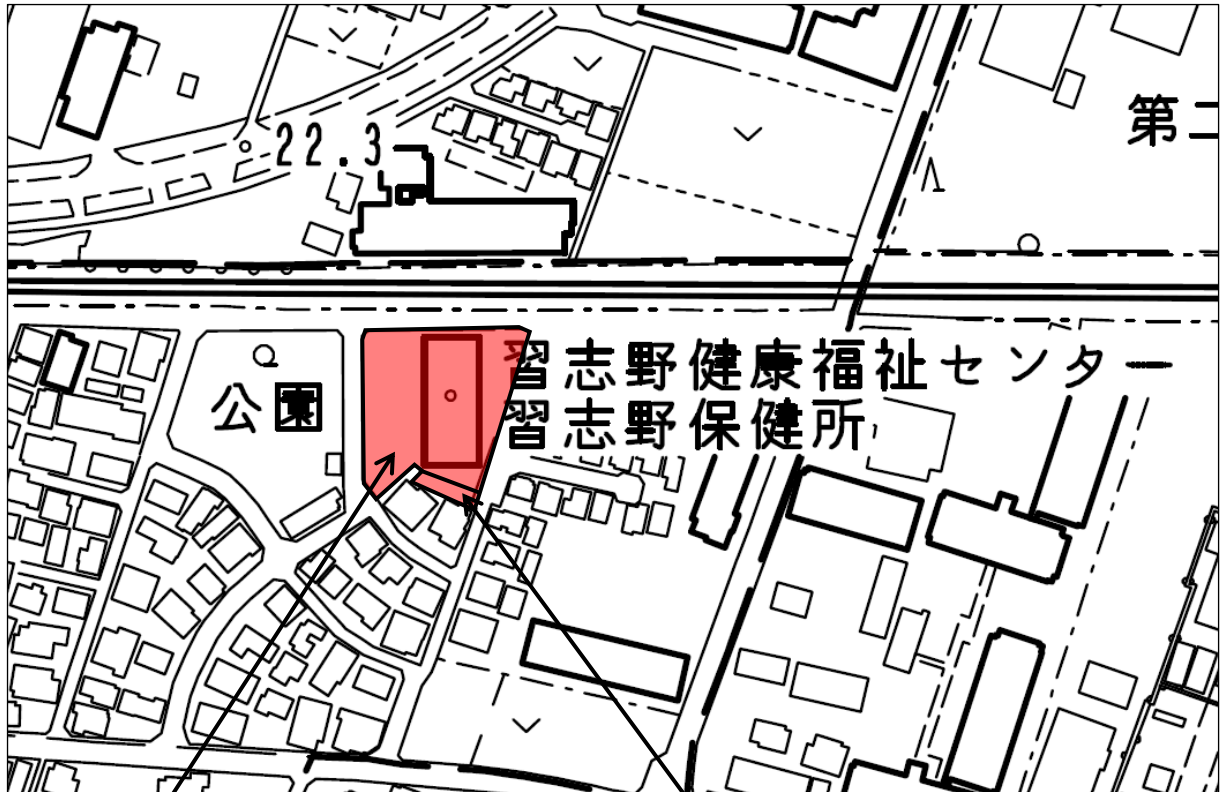
習志野健康福祉センター用地位置図（狭域）