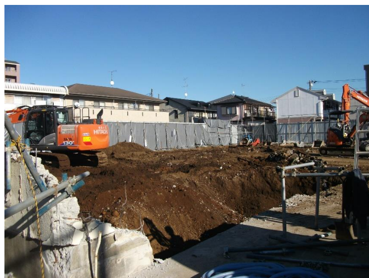
解体工事中（西側道路から）