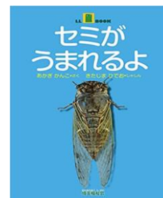
LLブック 「セミがうまれるよ」 あかぎ かんこ / さく きたじま ひでお / しゃしん (埼玉福祉会)