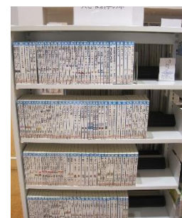
中央図書館で所蔵している 「講談社大きな文字の青い鳥文庫」