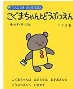
てんじつきさわるえほん 「こぐまちゃんとうぶつえん」 森 比左志 / 著 若山 憲 / 著 和田 義臣 / 著 (こぐま社)