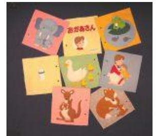
布絵本「おかあさん」 (ふきのとう文庫製作)