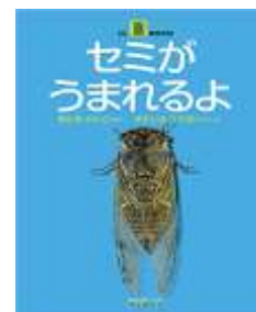
LLブック 「セミがうまれるよ」 あかぎ かんこ/さく きたじま ひでお/しゃしん (埼玉福祉会)