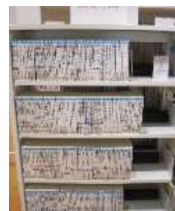
中央図書館で所蔵している 「講談社大きな文字の青い鳥文庫」