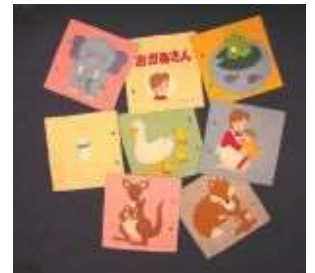
布絵本「おかあさん」 (ふきのとう文庫製作)