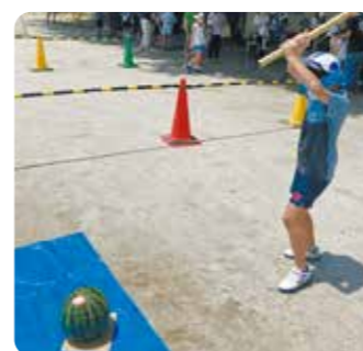
▲各地区での活動の様子▶