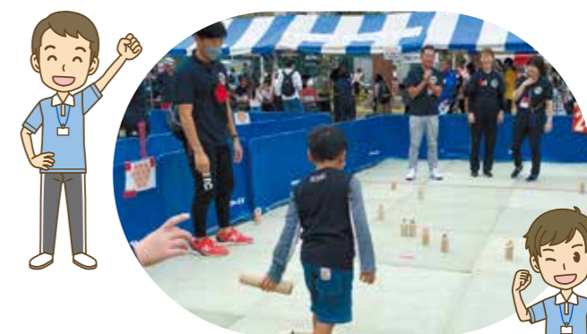
▲市民まつり子ども広場の様子