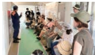
マンションでの消防職員を交えた防災訓練