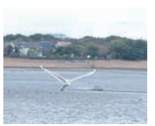
鳥も向かい風へ(谷津干潟)

境に例えた場合、飛躍するためのきっかけと捉えてはいかがでしょうか。なお、飛行機は離着陸時に強い追い風が吹くと中止します。これは滑走距離が延びてしまい危険だからです。身近な話では、自転車に乗っている時に風を感じない状態は追い風なのですが、ブレーキをかけると背中を押される風で止まりにくいことがあります。一概に追い風が楽であるということではなさそうです。昨今、情報社会の進展により価値観が無限に多様化する中、行政に求められる役割も同様で、かつ、高齢化と公共施設の老朽化が進むなど行財政運営の課題は増えています。しかし、これらの課題、向かい風は習志野市が発展するステップであると信じています。3月は行政の年度末です。多忙で不安定な時期ですが、新たに始まる直前でもあります。多様な価値観に対応した、いろいろな考え方を駆使して向かい風を受けて上昇してまいります。