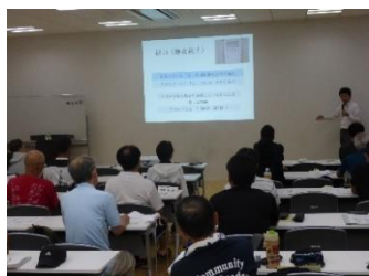
■市民スポーツ指導員養成講座の実施