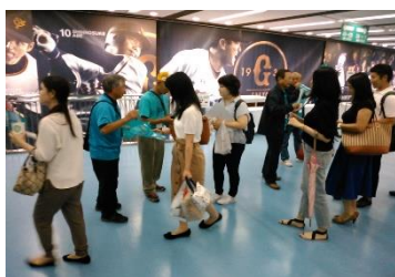
■チラシを配る市民ボランティア