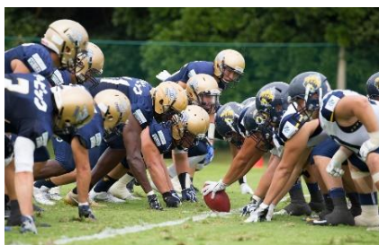
■アメリカンフットボール社会人チーム「オービックシーガルズ」ホームゲーム開催(第一カッターフィールド)