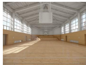
■中央公園体育館(旧勤労会館体 育場)リニューアル(令和元年度)