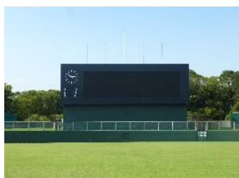
■第一カッター球場のフルカラー スコアボード(平成25年度)