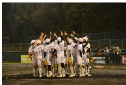
■世界女子ソフトボール選手権大会開催(第一カッター球場)