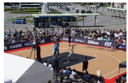
■SEALS.EXE「3×3.EXEPREMIER」開催(新習志野駅前広場)