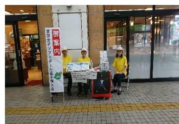
■案内所における都市ボランティア