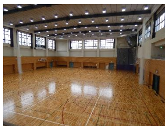
■東部体育館大規模改修工事の実施 (平成29年度)