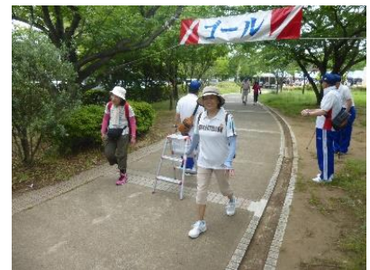
■スポーツ奨励大会「オール習志野歩け歩け大会」の開催