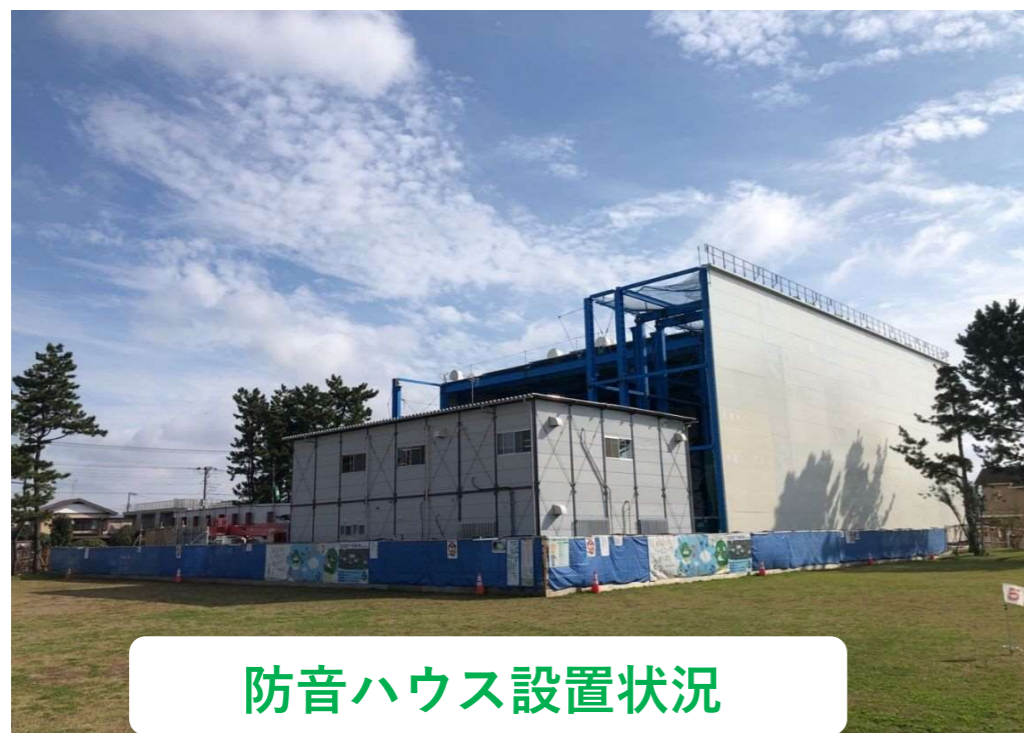
防音ハウス設置状況