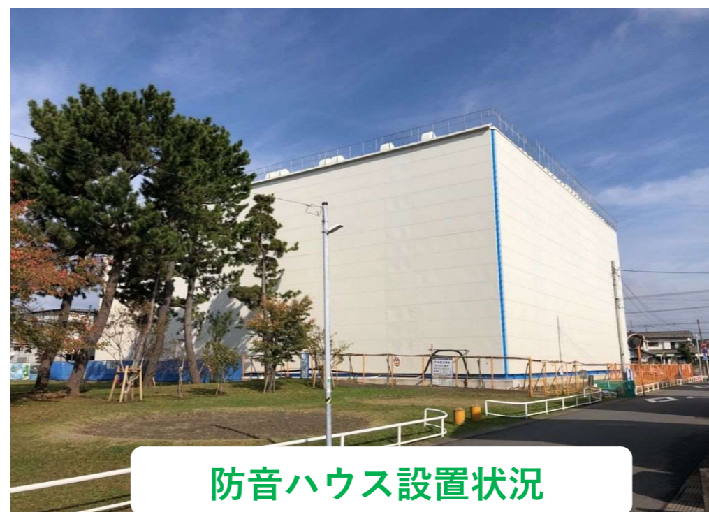
防音ハウス設置状況