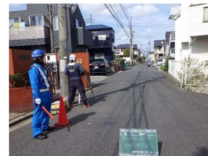
道路高さ測定状況

近隣の皆さま方におかれましては、工事期間中はご迷惑をおかけいたしますが、ご理解・ご協力くださいますようお願い申し上げます。