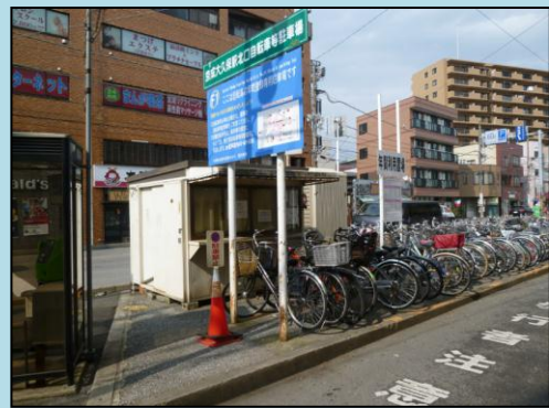
駅周辺の駐輪場の一例