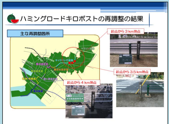
ハミングロードキロポスト再調整結果（第8回意見交換会資料 抜粋）