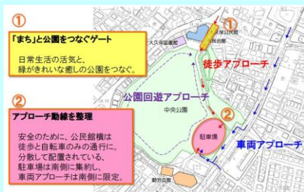
中央公園へのアプローチ