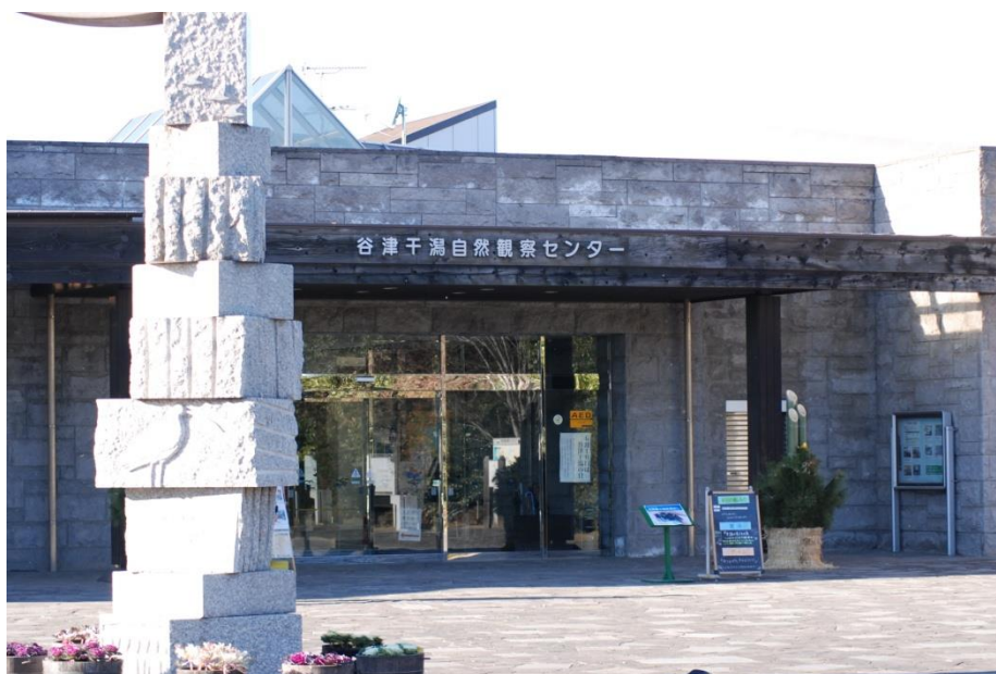
谷津干潟自然観察センター