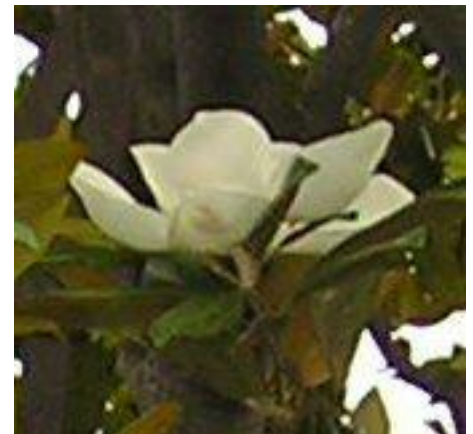
No.66 タイサンボクの花