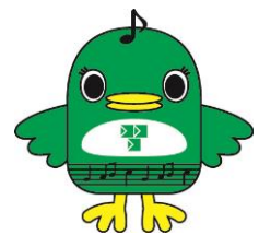
習志野市ご当地キャラ ナラシンド♪

習志野ソーセージの贈答用ギフト販売が始まりました。取扱店は下記のとおりです。御注文や価格等については各店舗に直接お問い合わせください。