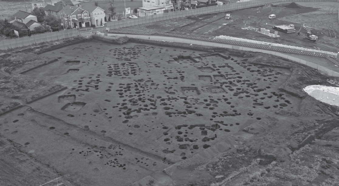
X-22c地点の 大型掘立柱建物跡群