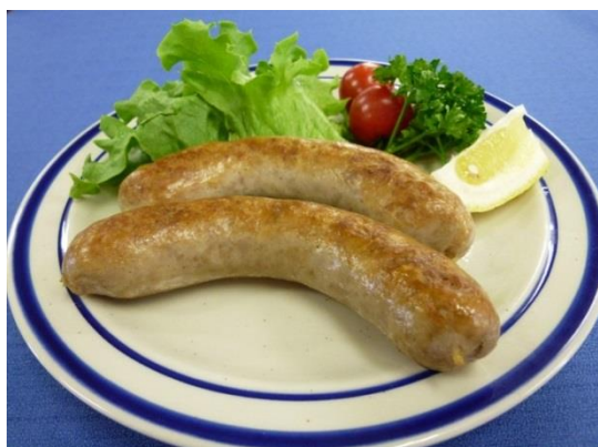
ならしのソーセージ