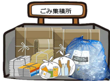
쓰레기 배출장소의 관리 향상

쓰레기 배출장소 내 쓰레기 분류가 알기 쉬워져, 수거 시간이 단축됩니다. 이에 따라 수거 누락이나 시간 지연 등이 방지됩니다.