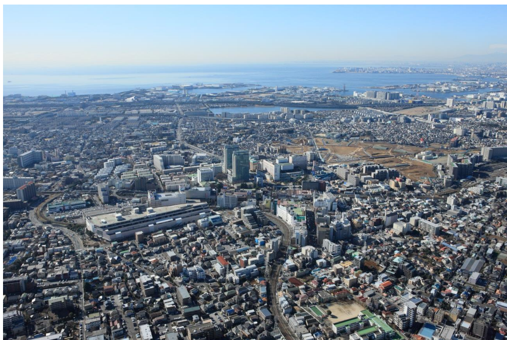
習志野市を空からのぞむ